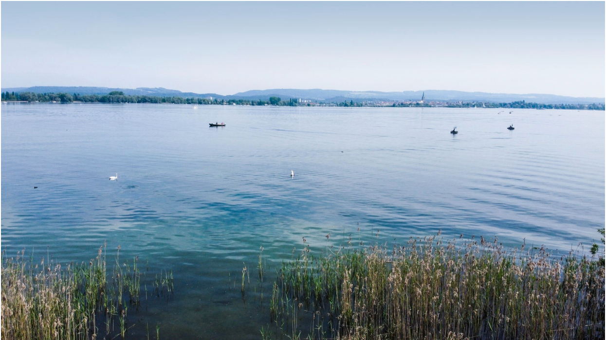
Blick vom Grundstück