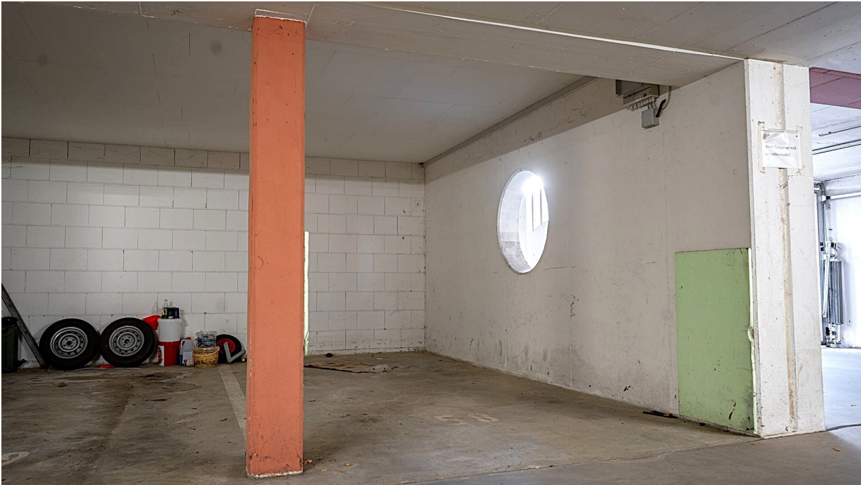
Tiefgaragenstellplatz Nr. 58