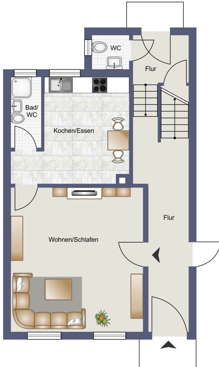
Grundriss Wohnung Nr. 1